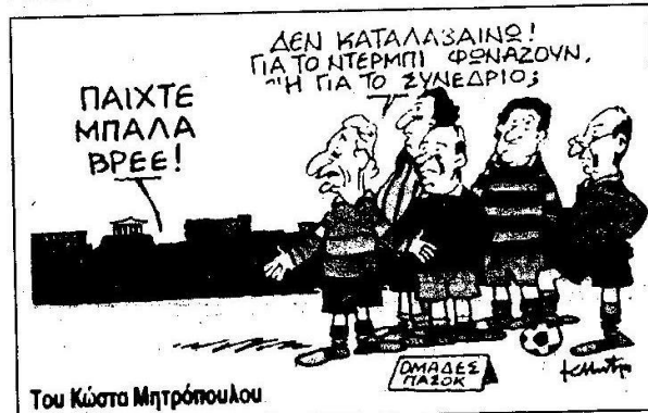
Του Κώστα Μητρόπουλου